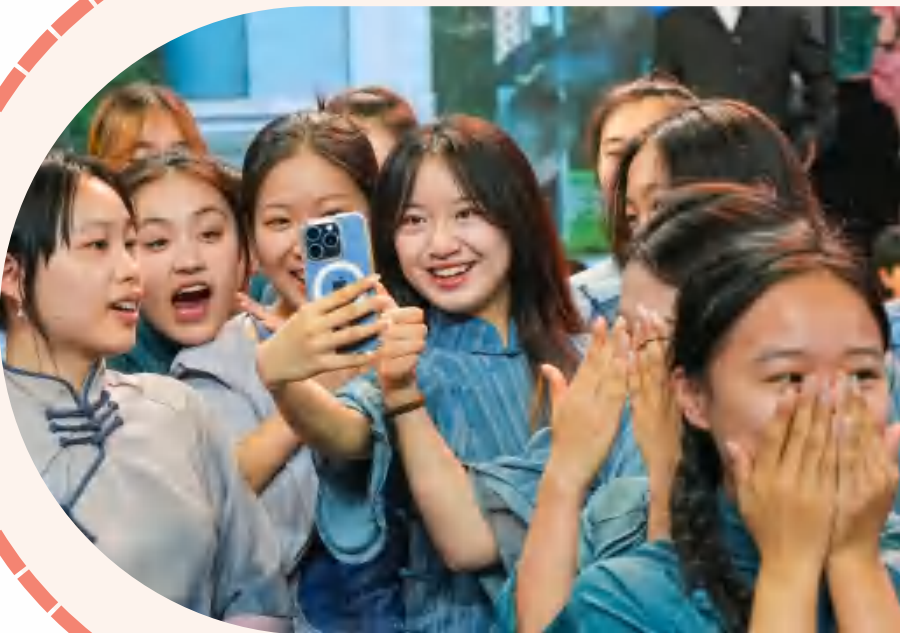
文艺晚会排练日常

虽然已记不清修改了多少版会议方案、工作方案和会议手册,但我仍清晰地记得校庆办每位老师的专业与细致,联络员们的耐心与支持,志愿者的热情与活力,以及在整个过程中大家互相鼓励的每一个瞬间,点点滴滴,时时刻刻无不体现出我们西财人的同心协力。