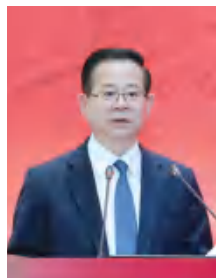
刘家强 全国政协常委、民革 中央副主席、中国人口 学会学术委员会主任

西南财经大学始终与国家休戚与共、与时代同频共振,以改革创新的勇气对事关高等教育特别是高等财经教育的重大问题作出新的实践探索,以开放包容的气度和胸襟积极参与高等教育的全球治理,以奋斗有我的责任和担当为建设教育强国、金融强国提供有力支撑,矢志成为中国高等财经教育的主要引领者、国际商科教育舞台上的有力竞争者、全面建成社会主义现代化强国的重要贡献者。高等财经教育要坚持自信自立、共同建设“大有可为”的高等财经教育;要坚持守正创新,合力建设“引领时代”的高等财经教育;要坚持开放合作,携手建设“多元包容”的高等财经教育。