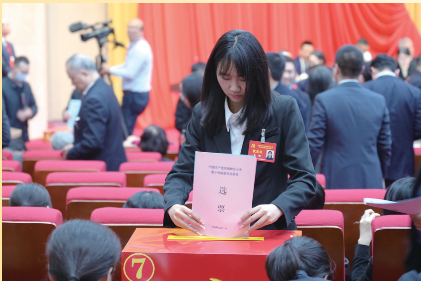
与会代表庄严投票