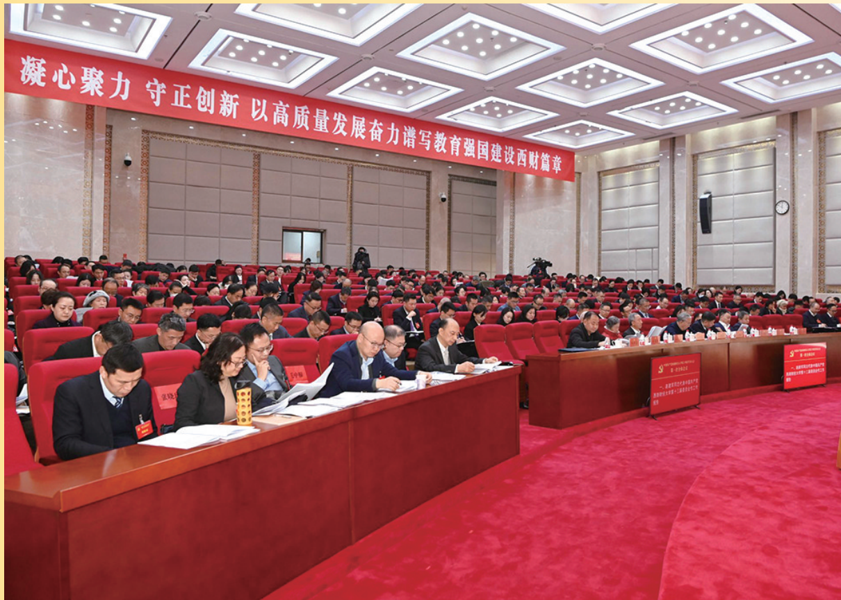
会场代表、嘉宾认真学习“凝心聚力 守正创新 以高质量发展奋力谱写教育强国建设西财篇章”大会报告