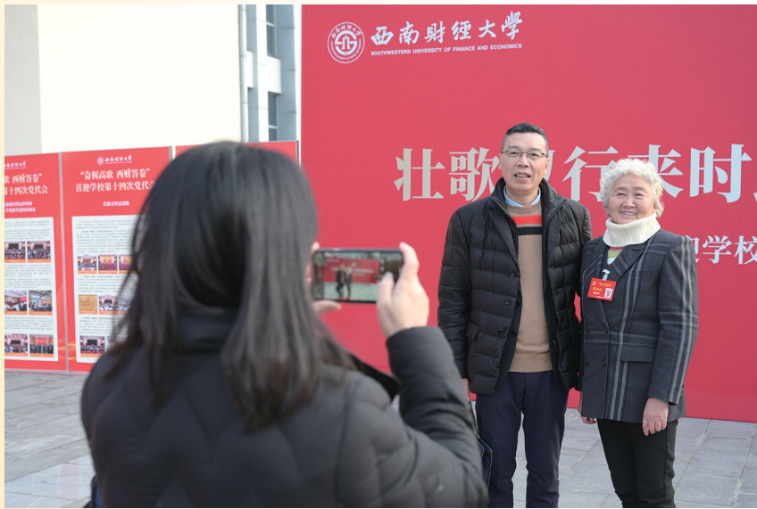
与会代表和老师们在柳林校区弘远楼会场前拍照留念

12月26-27日,中国共产党西南财经大学第十四次代表大会在柳林校区举行。239名代表齐聚一堂,履职尽责。大家认真听取党委工作报告,认真履行代表职责,认真审议工作报告,根据报告提出的目标任务要求积极谋划、建言献策。