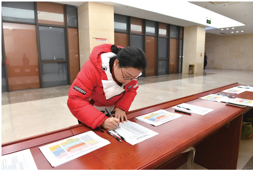
与会代表签到进场