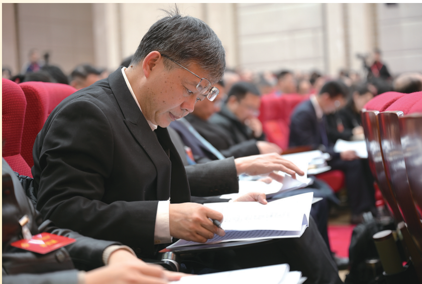
与会代表认真查看会议资料