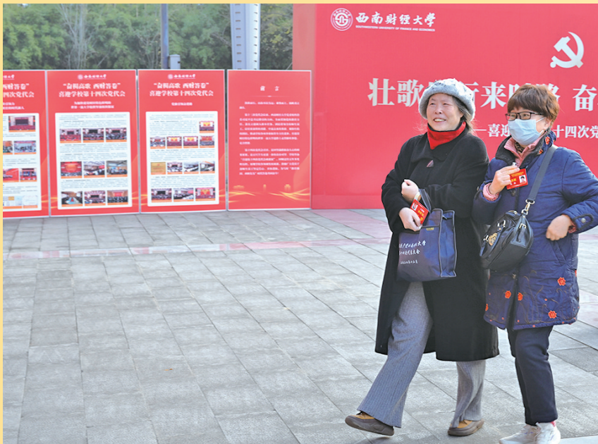
弘远楼前洋溢着浓厚的党代会氛围