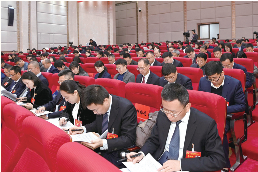
开幕式上,与会代表认真聆听报告