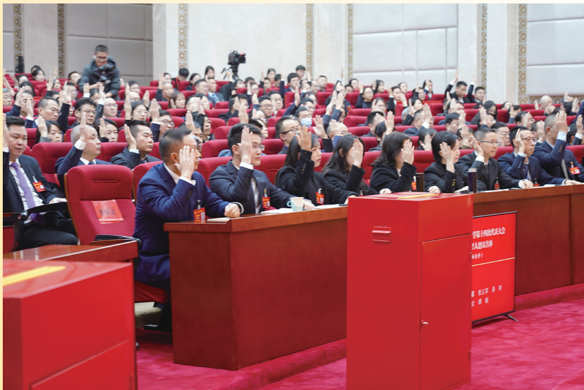
与会代表举手表决