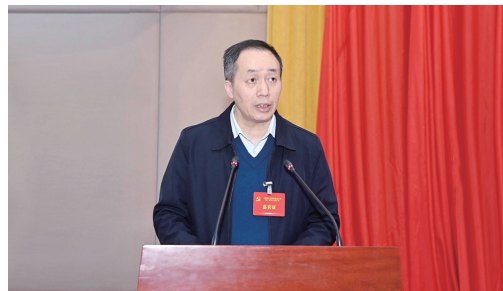
四川省教育厅一级巡视员胡卫锋同志讲话