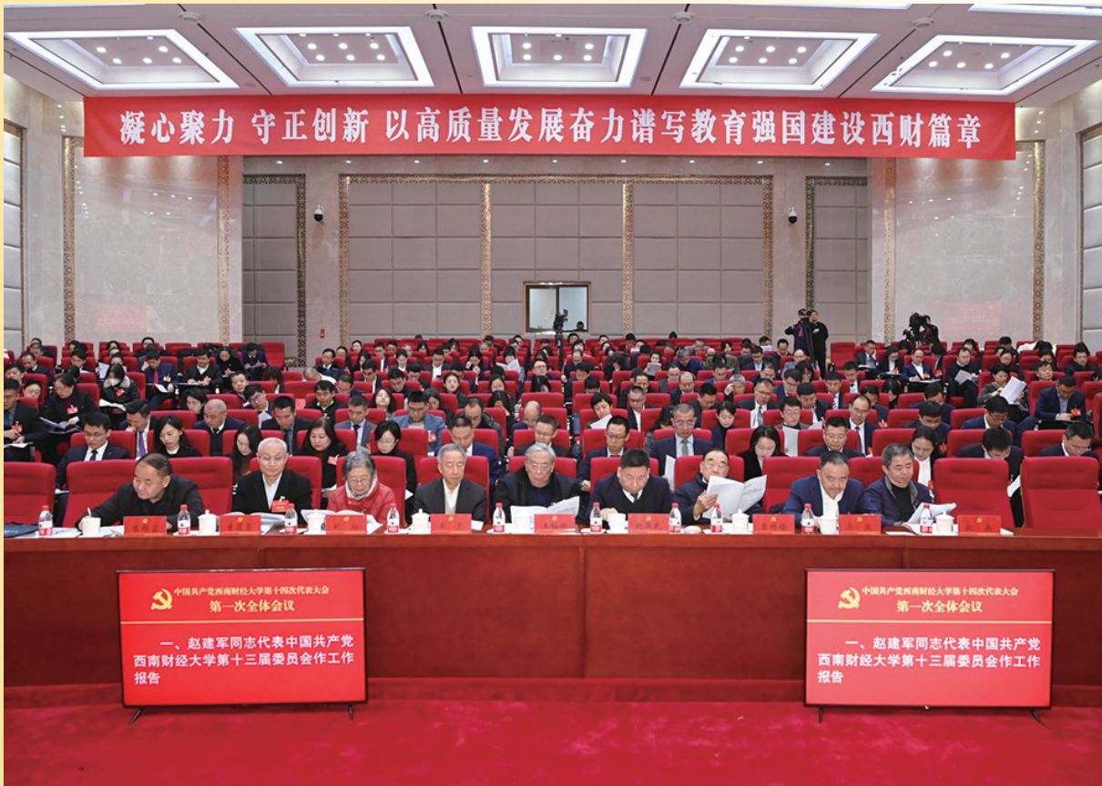
12月26日,中国共产党西南财经大学第十四次代表大会在弘远楼105会议室隆重开幕