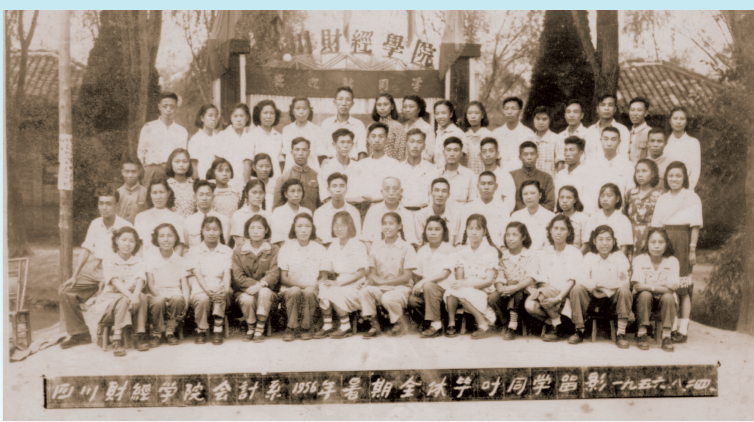
四川财经学院早期毕业生影像

1953年,社会主义过渡时期总路线的提出,开启了中国高等教育新篇章。在社会主义革命与建设时期,学校坚决贯彻党的“为无产阶级政治服务,与生产劳动相结合”教育方针,努力为国家培养“又红又专”社会主义建设者,探索中国高等财经教育服务社会主义新中国建设的道路。