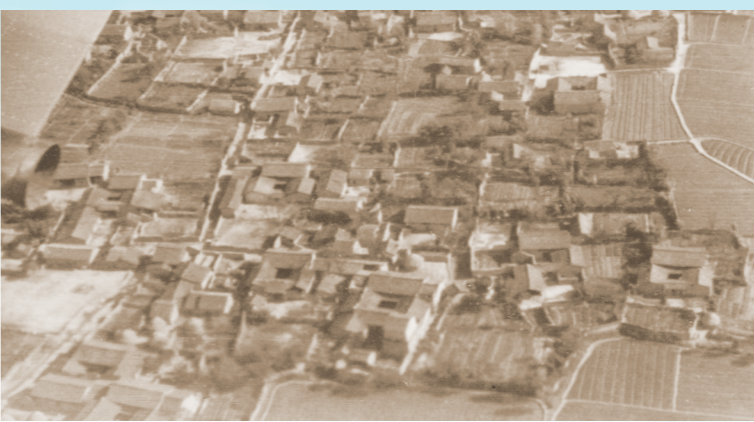
20世纪50年代校园全景

新中国成立后,党和国家开始接管、调整并改革原有的高等教育体系。为贯彻“对财经政法各院系采取适当集中,大力整顿”的院系调整方针,按照“每大区在条件具备时,得单独设立一所财经院校”的原则,私立成华大学改为公立,并以此为主体,在1952—1953年先后调入成都会计专科学校全部及华西大学经济学系、川北大学企业管理系、重庆大学银行保险系、重庆财经学院经济系等16所财经院校及综合性大学的财经系科,组成四川财经学院。四川财经学院成为当时西南地区唯一的一所综合性高等财经院校,也是全国仅有的四所本科财经院校之一。