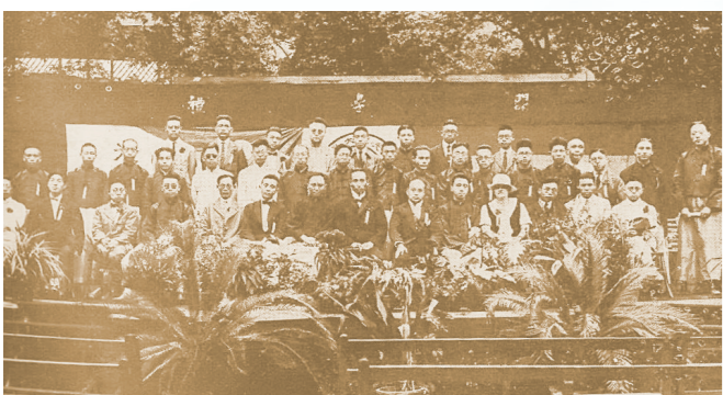
光华大学第一次开学时全体教职员合影

20世纪20年代国民革命风起云涌,国民族意识日渐觉醒。爱国人士对西方教会学校开展的文化入侵痛恨不已,越来越多的进步师生投身收回教育权运动。因“五卅”反帝爱国运动而诞生的光华大学就是历史见证。