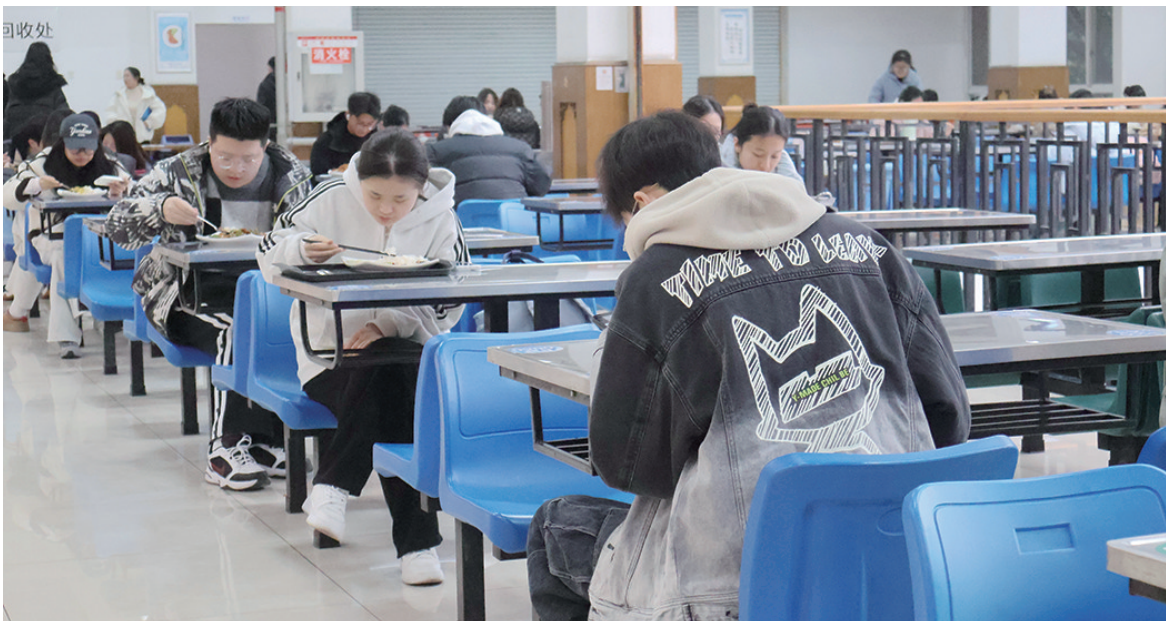
暂停匆忙脚步,细品美味佳肴