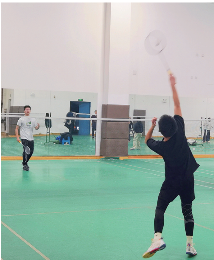
强身健体进行时,体育馆内挥拍忙