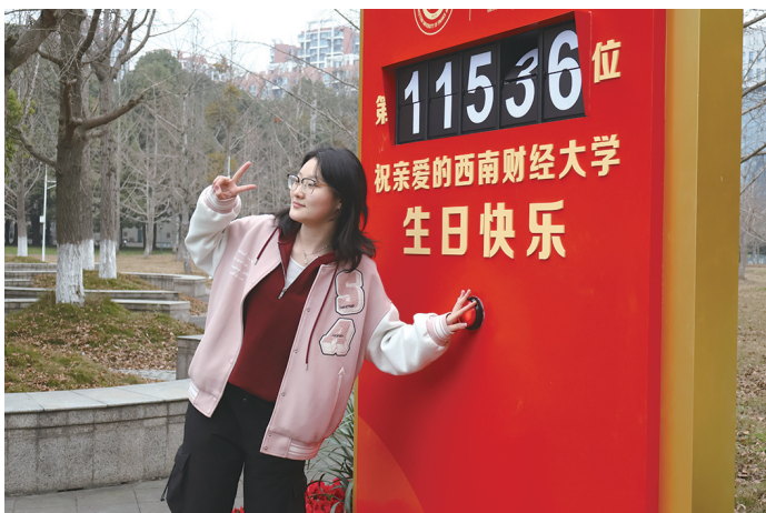
百年校庆倒计时,我为母校送祝福

早春西财,春意盎然,书声琅琅。伴随着新学期的到来,校园更加勃勃生机。开学第一周,记者走遍校园角落,用图片定格活力满满的开学瞬间。