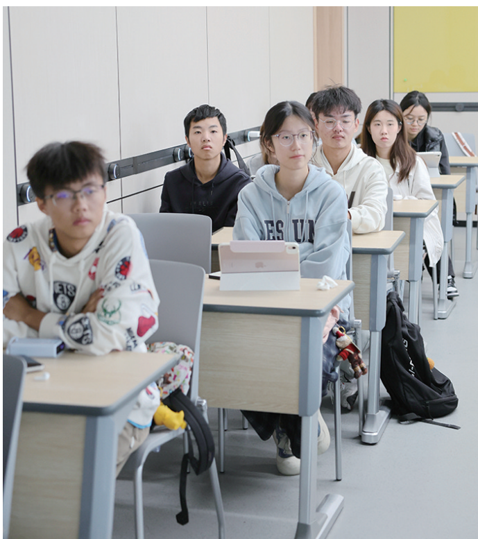
开学第一课,同学们认真聆听、求知若渴