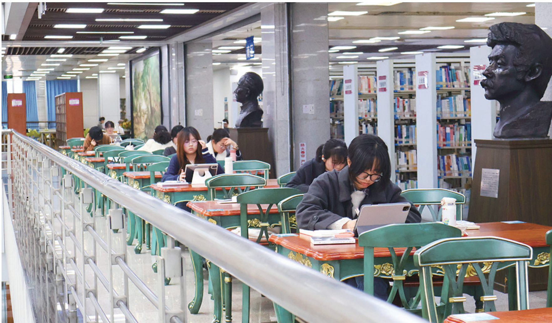
细思时专注,落笔处有神,新学期图书馆的学习景象