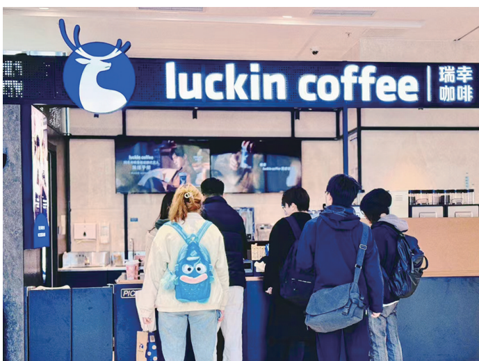
校园饮品店“上新”,生活便利再升级