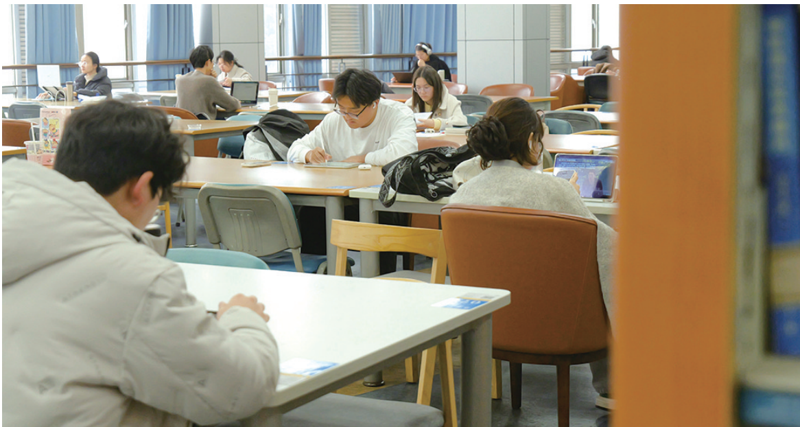
书桌小,书海阔,自习室里学习忙