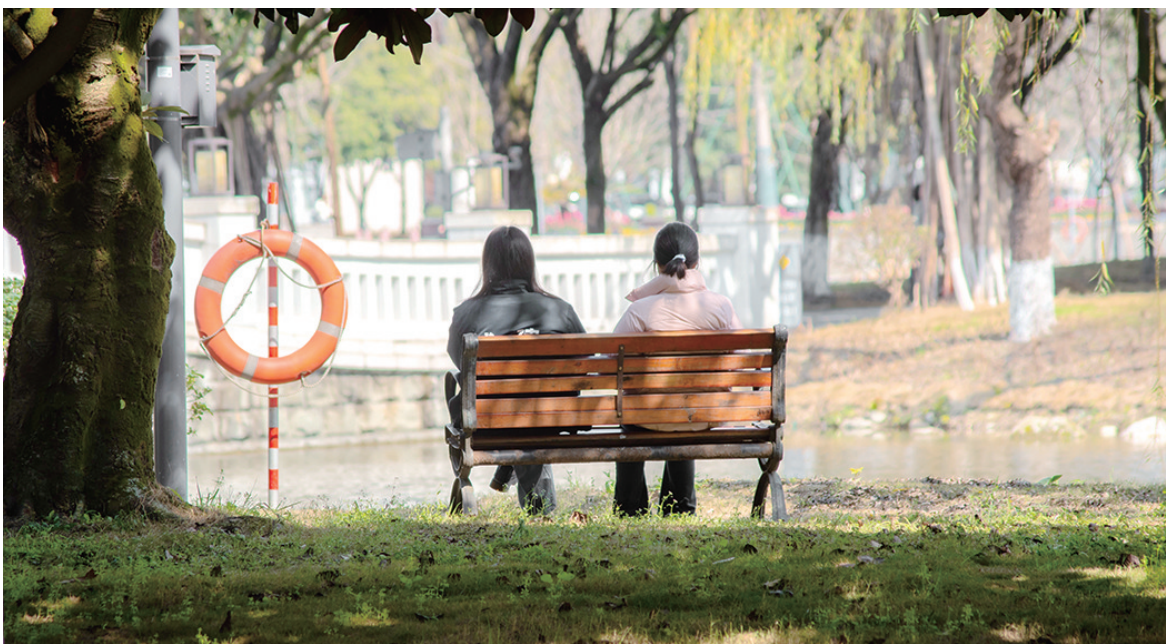
一年之计在于春,微风拂面暖人心